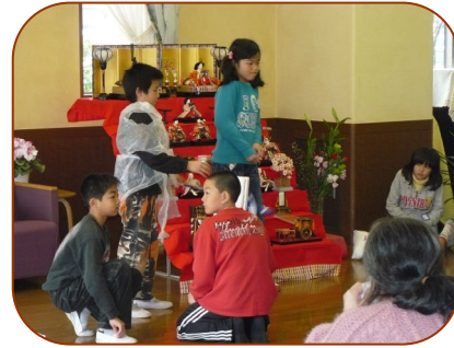
ももたろう家来を引き連れて

この日は5年生の生徒さん36名が来られ、司会・進行全て生徒さんが引き受け、プログラムを進めてくれました。グループごとによる寸劇は、「シンデレラ」「ももたろう」「眠れる森の美女」「3匹のこぶた」。合唱は全員で元気良く音楽にのり、伴奏も生徒さんで、とても上手だったので思わずアンコールをお願いして、もう一曲歌ってもらいました。