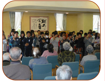
クラス全員で気持ちをこめて